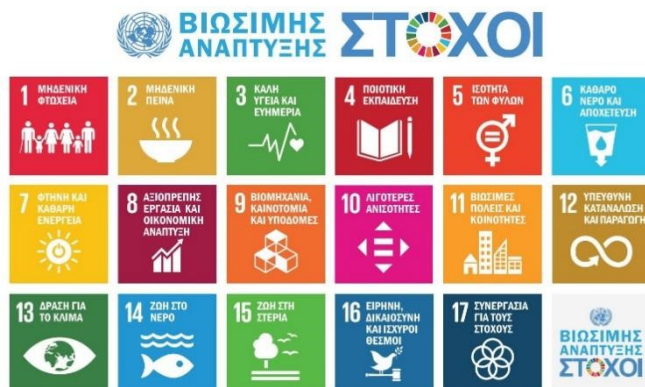
Εικόνα 6: 17 Στόχοι Βιώσιμης Ανάπτυξης

καταπολέμηση της ανισότητας και της αδικίας και την προστασία του Πλανήτη μας. Η «Ατζέντα 2030» αποτελείται από τους 17 Στόχους Βιώσιμης Ανάπτυξης (Sustainable Development Goals – SDGs) και 169 ειδικότερους στόχους (targets) που αναφέρονται στις σημαντικότερες προκλήσεις της εποχής μας, οικονομικές, κοινωνικές, περιβαλλοντικές και διακυβέρνησης.