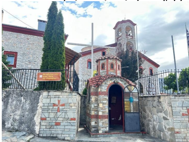
Εικόνα 2: Μεταβυζαντινός ναός Αγίου Δημητρίου, Κάτω Νευροκόπι