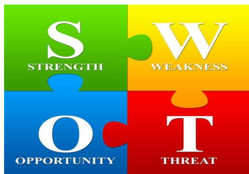
Εικ. 4.. SWOT Template.

ανταγωνισμός, κυρίως με το γειτονικό και τουριστικά ανεπτυγμένο Ναύπλιο. Οι παράγοντες αυτοί υπογραμμίζουν την ανάγκη υιοθέτησης στοχευμένων και δυναμικών διαρθρωτικών παρεμβάσεων για την αναβάθμιση και τη βιώσιμη ανασυγκρότησή του. Η μελέτη της πόλης εντάσσεται στο ευρύτερο πλαίσιο αξιολόγησης αστικών τοπίων βάσει των τεσσάρων πυλώνων της βιώσιμης ανάπτυξης – περιβάλλον, κοινωνία, οικονομία και πολιτισμός – καθένας από τους οποίους συμβάλλει καθοριστικά στη διαμόρφωση μιας ολιστικής στρατηγικής για την αναβάθμιση της ποιότητας ζωής των κατοίκων και την ενίσχυση της κοινωνικής συνοχής και της ταυτότητας του αστικού χώρου (Culture 21, UCLG, 2002–2004).