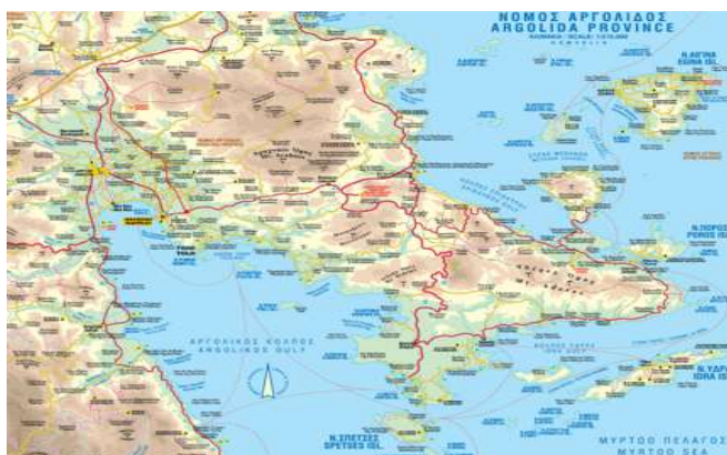
Εικ. 2. Γεωφυσική θέση της πόλης του Άργους στον ελλαδικό χώρο.

Η πόλη του Άργους θεωρείται μία από τις παλαιότερες συνεχώς κατοικούμενες πόλεις στον κόσμο. Αρχαιολογικές ανασκαφές στη Νότια Συνοικία του Άργους δείχνουν συνεχή ανθρώπινη παρουσία από τις πρώιμες Μεσοελλαδικές φάσεις (Balitsari, 2019). Αναπτύχθηκε σε θέση που ήταν πιθανώς κατοικημένη ήδη από την Πρώιμη Εποχή του Χαλκού και στους Μυκηναϊκούς χρόνους, γεγονός που την καθιστά έναν από τους αρχαιότερους συνεχώς κατοικούμενους οικισμούς στην Ελλάδα και την Ευρώπη (Britannica, 2023). Κατά την Ύστερη Εποχή του Χαλκού αποτέλεσε ένα από τα σημαντικότερα κέντρα του Μυκηναϊκού Πολιτισμού, διατηρώντας ιδιαίτερη στρατηγική και πολιτισμική σημασία. Η συνεχιζόμενη κατοίκηση αποδεικνύεται από πλήθος αρχαιολογικών ανασκαφών στην περιοχή, όπως η οικία των Πιθοποιών (House of Pitheoi), χαρακτηριστικό δείγμα της Μεσοελλαδικής κατοίκησης στο νότιο τμήμα της πόλης (Balitsari, 2019). Επιπλέον, υπάρχουν αναφορές ότι η ανθρώπινη παρουσία στην περιοχή ξεκινά από τη Νεολιθική εποχή, περίπου πριν 7.000 χρόνια, με εγκατάσταση στους πρόποδες του λόφου Aspida (Wikipedia, n.d.).