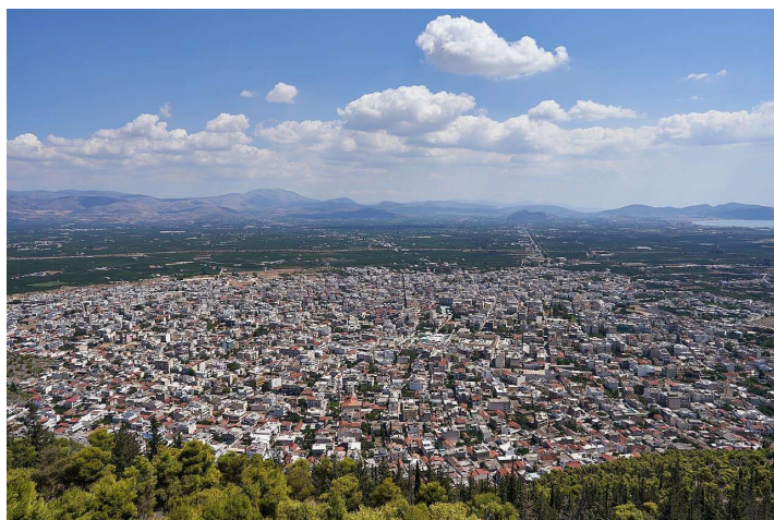
Εικ. 3 Η πόλη του Άργους από το Κάστρο της Λάρισας, 5 Σεπτεμβρίου 2020

Η πόλη του Άργους παρουσιάζει σημαντικές προκλήσεις στον τομέα της πολεοδομικής οργάνωσης. Η έλλειψη πράσινων χώρων και υποδομών βιώσιμης κινητικότητας, σε συνδυασμό με την άναρχη δόμηση και το περιορισμένο οδικό δίκτυο, επηρεάζουν αρνητικά την ποιότητα ζωής των κατοίκων. Επιπλέον, το έντονο κυκλοφοριακό πρόβλημα, η έλλειψη επαρκών χώρων στάθμευσης και η περιορισμένη ανάπτυξη δημόσιας συγκοινωνίας δυσχεραίνουν την καθημερινή μετακίνηση, ενώ η συνύπαρξη παλιών και σύγχρονων κτιρίων δημιουργεί προβλήματα αισθητικής συνοχής. Τα παραπάνω καταδεικνύουν την ανάγκη για ολοκληρωμένο πολεοδομικό σχεδιασμό που θα ενσωματώνει αρχές βιώσιμης ανάπτυξης και θα προάγει την αναβάθμιση της καθημερινότητας των κατοίκων, με στόχο τη διασφάλιση ενός λειτουργικού και ελκυστικού αστικού περιβάλλοντος (Beatley, 2016).